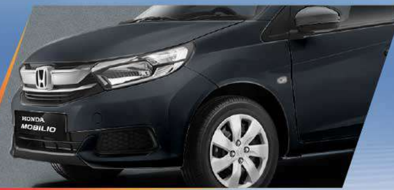
Meteoroid Gray Metallic