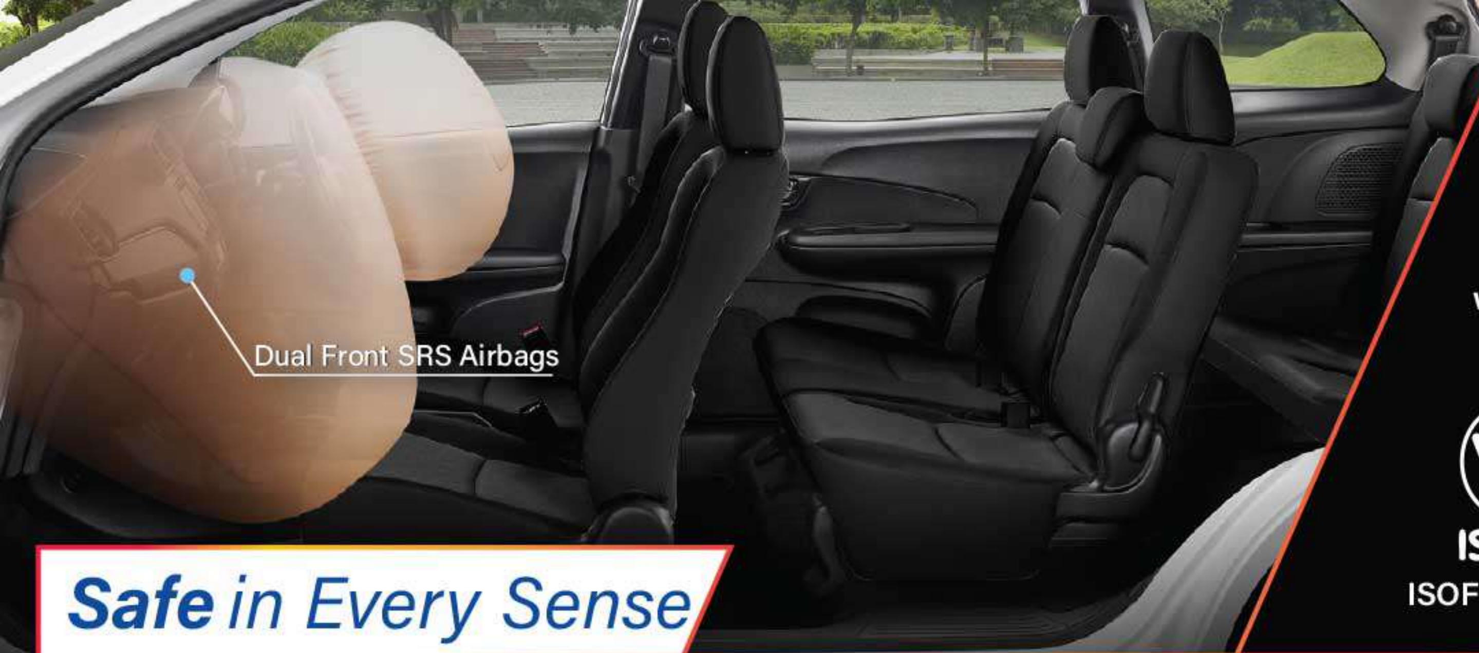
Dual Front SRS Airbags